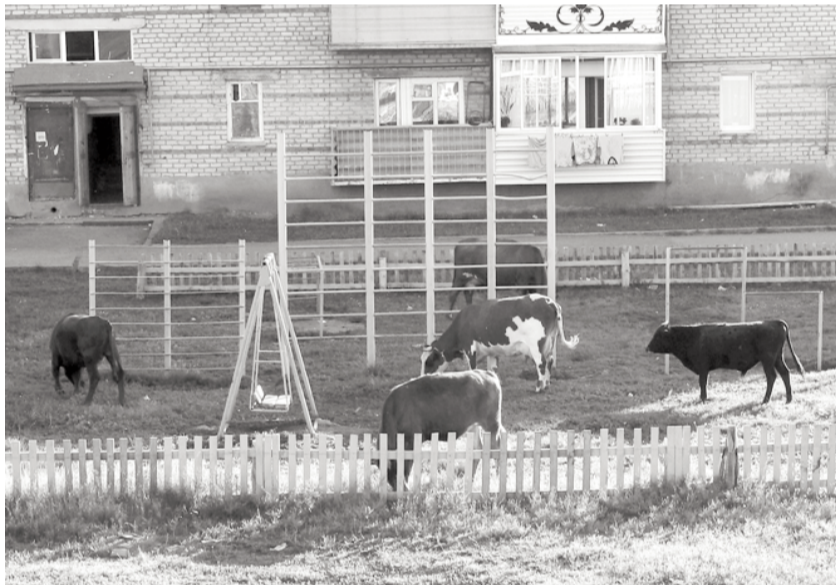
Буренки на детской площадке в Микрорайоне.